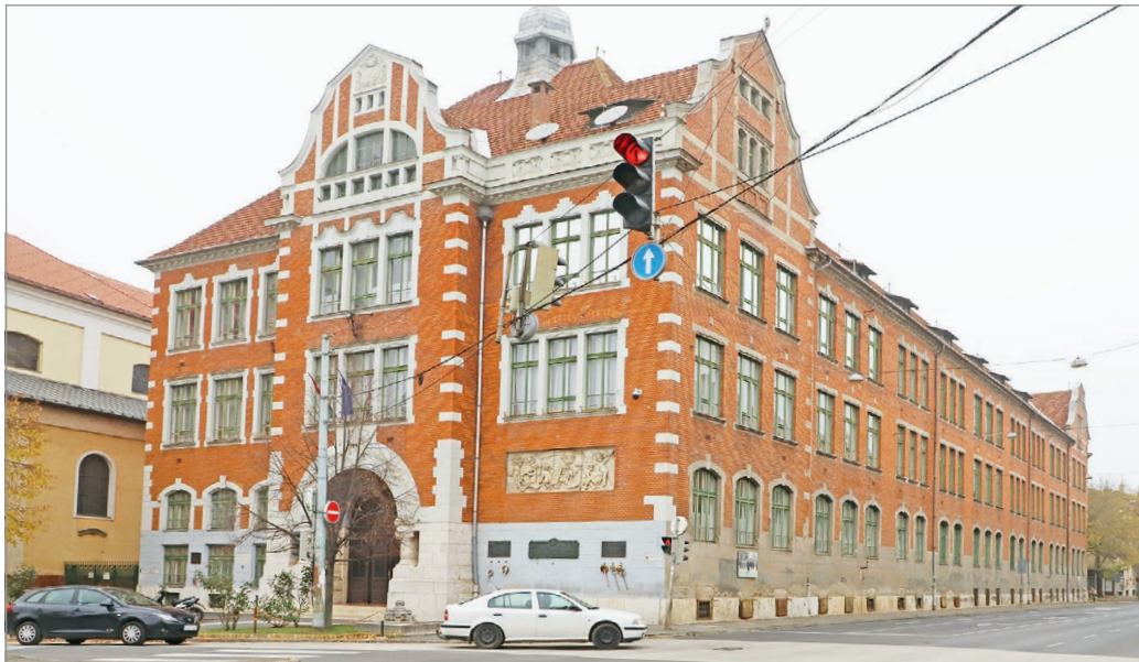
A Földes Ferenc Gimnázium a jövőben is a város tulajdonában marad.