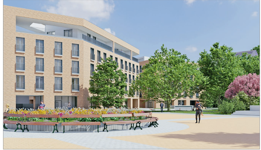
A főtéren mellé tervezett társasházkomplexum tervei már elkészültek.