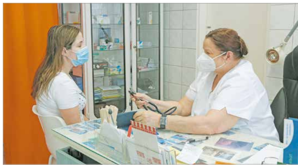
Van olyan háziorvos, aki saját praxisa mellett még két másik körzetben helyettesít.