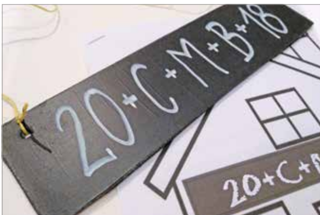
A házszentelés hagyománya jellemzően vízkereszthez kötődik

Az emberek körében kedvelt esemény, amikor a papok megszentelik a község vagy a