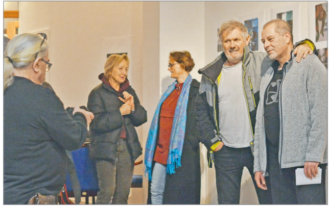
A tárlat a hónap végéig tekinthető meg a MÚHA-ban.