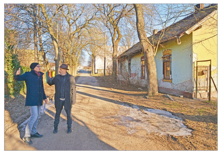
Az értékes területtel valamit kezdenie kell a városnak.

A terület közel felét azok az önkormányzati bérlakások teszik ki, melyek lakói hosszú évek óta méltatlan környezetben kénytelenek élni. Minde mellett az önkormányzat a Magyar Máltai Szeretetszolgálattal is működteti azt a felzárkóztató programját, melynek keretében még négy évig átmeneti lakásokat tartanak fenn.