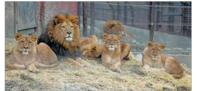
Az állatoknak bealmozott száraz helyet is kialakítanak télen