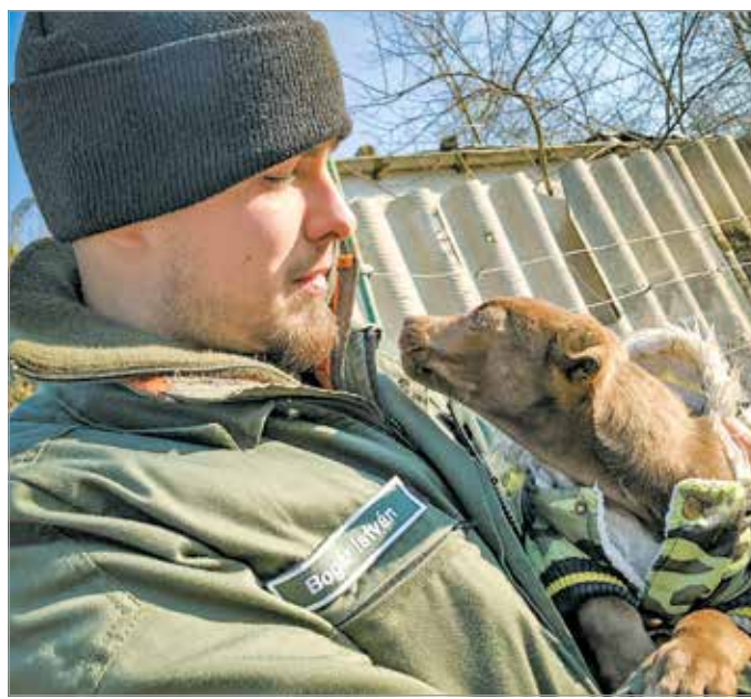
A rendészek a szívükön viselik mentettük sorsát.