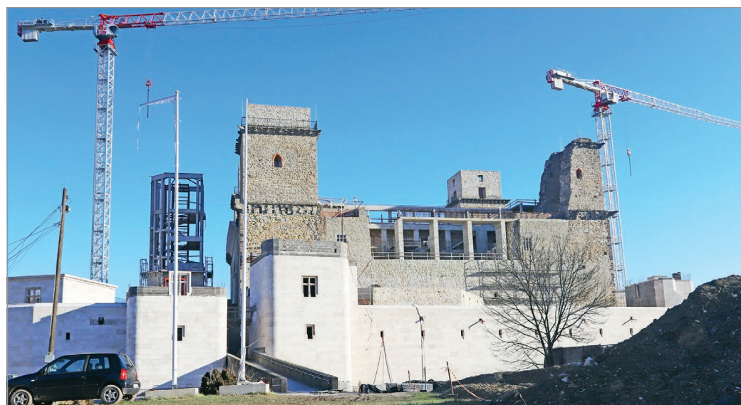
Csaknem egy éven át szünetelt a vár rekonstrukciója.

Az Építési és Közlekedési Minisztériumnak július elsejéig kell döntést hoznia a többletforrás biztosításáról. Ha a támogatás megérkezik, akkor a tervek szerint a vár 2025 közepéig készül majd teljesen. T.Á.