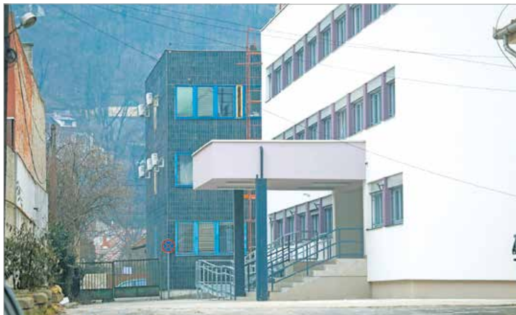
A szociális és köznevelési osztály épületét 275 millió forintból korszerűsítették.

Mindennek keretében a polgármesteri hivatal Petőfi u. 39. szám alatt található szociális és köznevelési osztálya épületének energetikai korszerűsítését közel 275 millió forintos bruttó támogatással valósították meg. Ennek során kicserélték a homlokzati nyílászárókat, és az épület utólagos külső oldali hőszigetelést kapott, de a lapos tető hő- és vízszigetelését is ezzel egy időben újították fel. A gépészeti rendszer korszerűsítése révén új radiátorokat és csőhálózatot építettek ki, a meleg vizet immár villanybojlerek biztosítják. A tetőfelületre napelemek kerültek a környezetbarát elektromos energia előállítás érdekében. Az épületet akadálymentessé tették az újonnan kialakított parkolóval, bejárattal és mosdóval.