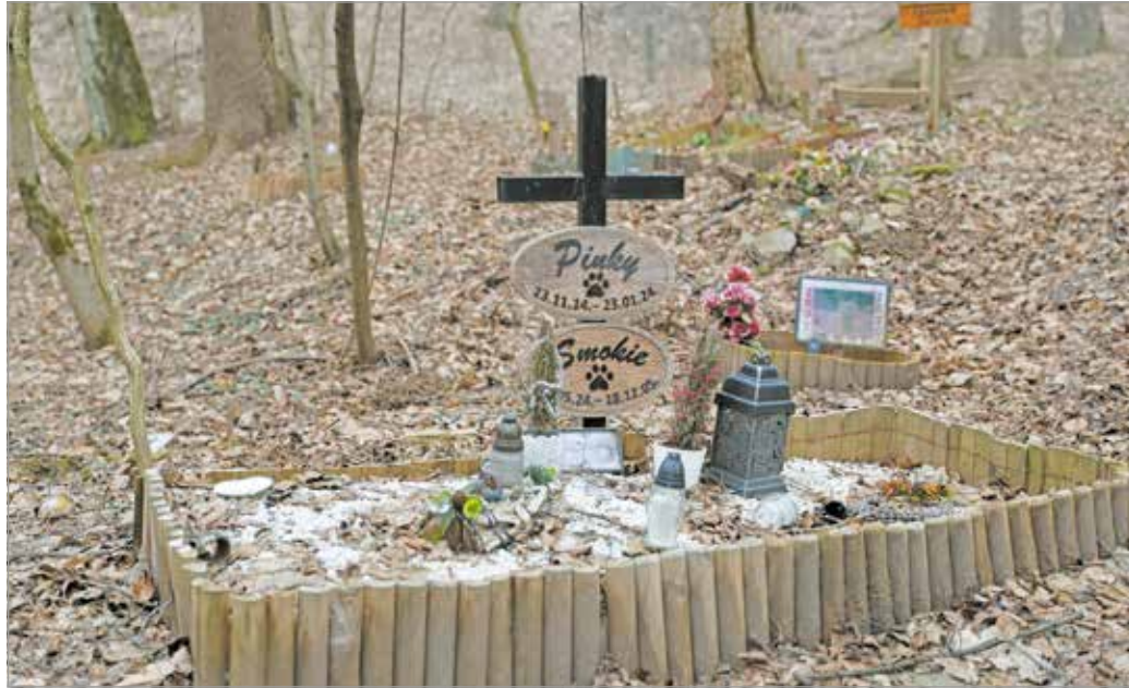
A Csanyikban található kisállattemető igénybe veszik a gazdik, de az nem legálisan működik.