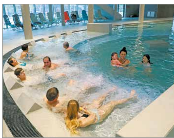
Az Ellipsum Élményfürdő december elején nyitott meg újra.

Az erőfeszítés meg is hozta a gyümölcsét – a Miskolci Fürdők Kft. ügyvezetőjének számításai szerint a hétvégéken, valamint a két ünnep között napi hétszáz feletti látogatót vonzottak be csempefalaiik közé. Hozzátette: azon dolgoznak, hogy az érdeklődés az új