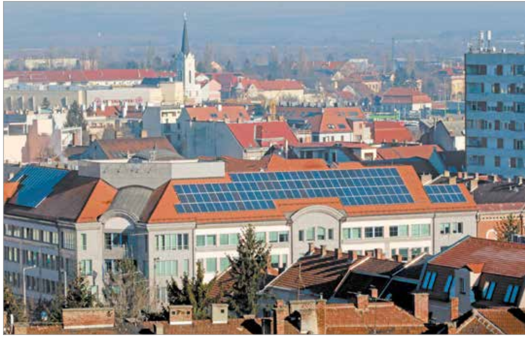
A panelek jellemzően 25-30 évig 80 százalék feletti energiatermelésre képesek.

Az akkumulátoros tárolási lehetőség nem véletlenül került bele az aktuális pályázatba, mint ismert, a kormány a tavalyi évben uniós előírás szerint megszüntette az úgynevezett éves szaldóelszámolást az áramot termelő, háztartási méretű kiserőművel (HMKE) rendelkezők és az áramszolgáltatók között, és bevezette a havi bruttó elszámolást. A változás lényege, hogy a továbbiakban már nem az adott év végén összesítik a hálózatba betáplált, otthon fel nem használt áram és a hálózatból vételezett áram mennyiségét, és ezeket egymásból kivonva számolnak el a napelemesek a szolgáltatóval, hanem havonta. A fogyasztók számára kedvezőbb volt az éves szaldóelszámolás, aminek oka maga a természet. Egy napelemes rendszer