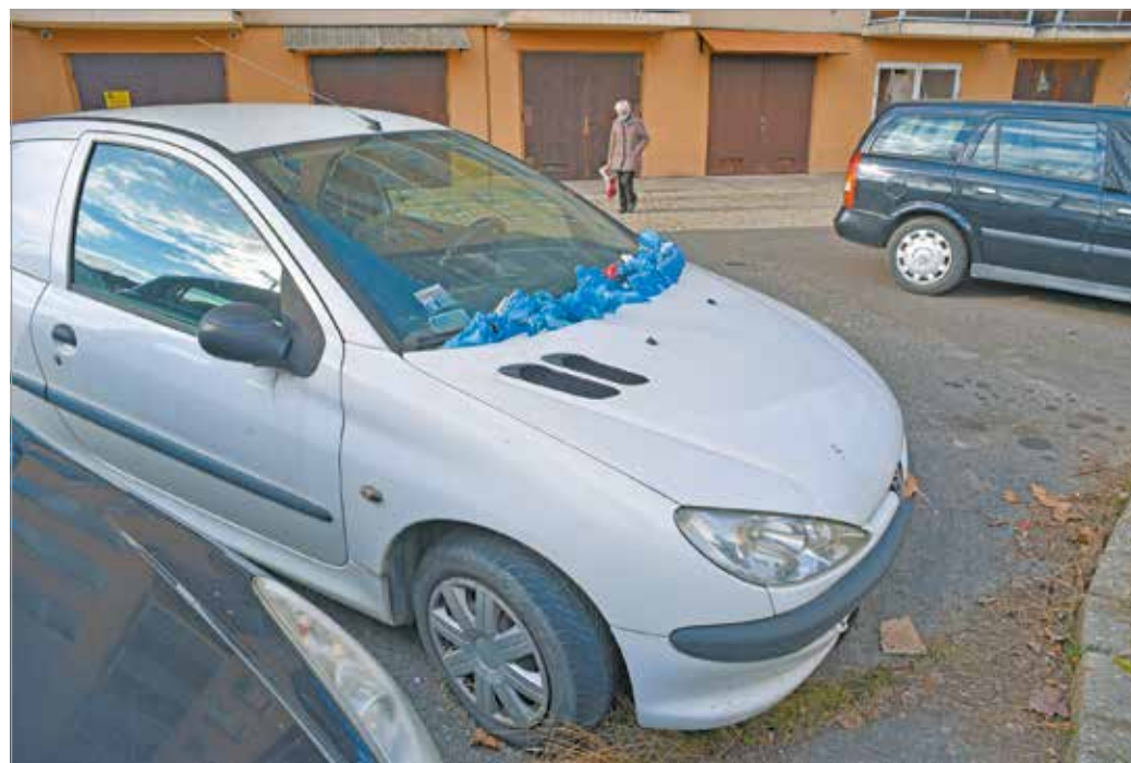
Értékes parkolóhelyeket foglalnak el a használaton kívüli járművek.

Az igazgató hangsúlyozta, a MIÖR hatáskörébe csak az önkormányzati közterületek tartoznak, a magán- vagy állami területen álló üzemképtelen járműveket nem náluk kell bejelenteni. Az intézkedési protokoll minden esetben az, hogy