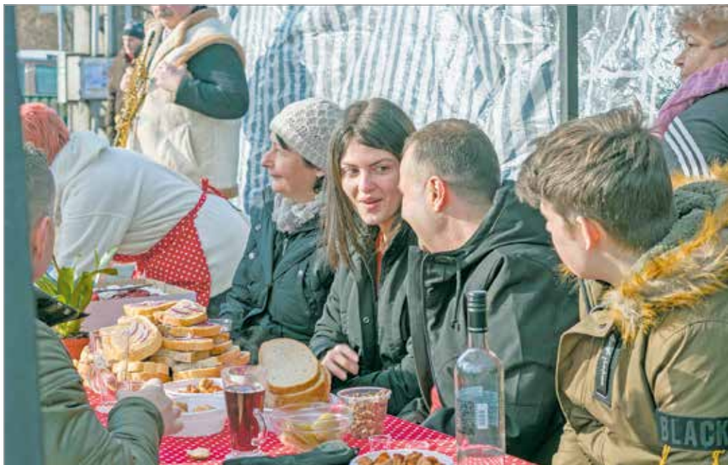
Legutóbb 2020 januárjában rendezték meg a népszerű programot.

A gasztronómia adja a téli esemény lelkét: a térről kilátogatók különleges forralt borokat kóstolhatnak, valamint disznótoros hideg és meleg ételeket fogyaszthatnak a nap folyamán: ezek között is a tepertő kerül rivaldafénybe. A Forralt Bor és Tepertő Napon az árusok is kiterítik majd portékáikat, amikből vásárolhatnak az érdeklődők.