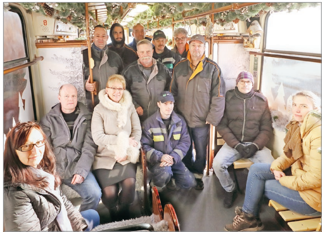
Ők alakították mesebeli erdővé az öreg Tátrát.