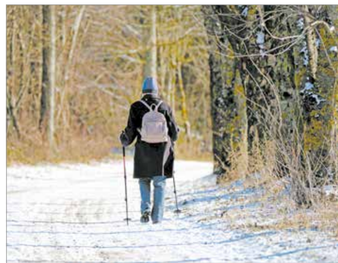
A farkasok az embert nem tekintik zsákmánynak.

Az egész Északi-középhegységben előfordulnak farkasok, de rejtetten.