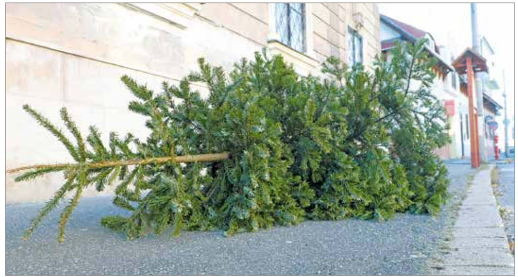
Egyre több helyen várnak szállításra a kidobott fenyőfák.