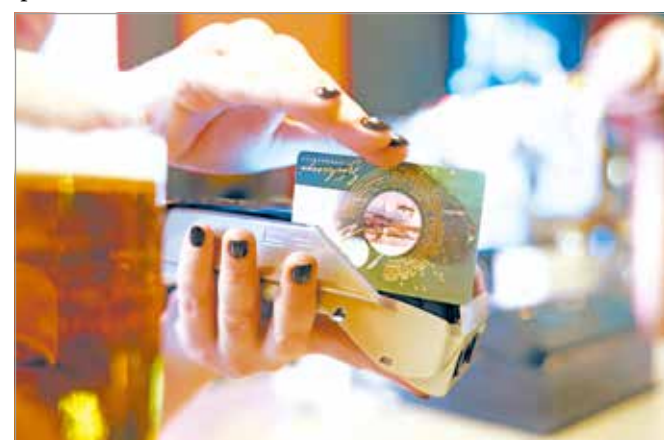
A hosszú hétvégéken és nyáron nőhet meg igazán a SZÉP-kártyás foglalások száma.