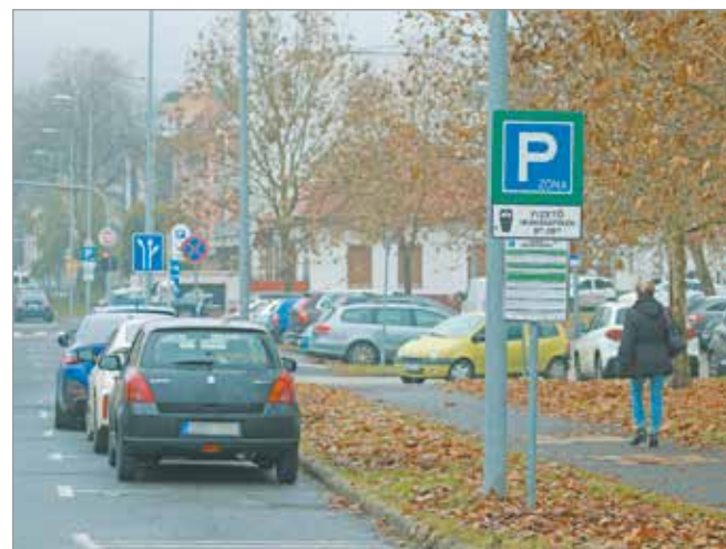
Az online parkolóberlettel rendelkezőknek nincs szükségük a szelvédre kiragasztandó matricára.

A parkolást azonban nem csak az online felület teszi kényelmesebbé Miskolcon. A területért felelős alpolgármester lapunknak arról számolt be, hogy húsz darab, teljesen új parkolóautomata telepítése van épp folyamatban, de jó párnak cserélik majd ki belső alkatrészeit. Badány Lajos kifejtette: az érintőképernyővel ellátott eszközök a gépjármű rendszámának megadásával működnek majd, melyeknél bankkártyával is lehet fizetni. A kedvezményes lakossági, a lakcímhöz választható és az intézményi bérletek január 20-áig maradnak érvényben. A parkolóberletek online megváltására egész évben lehetőségünk nyílik. MN