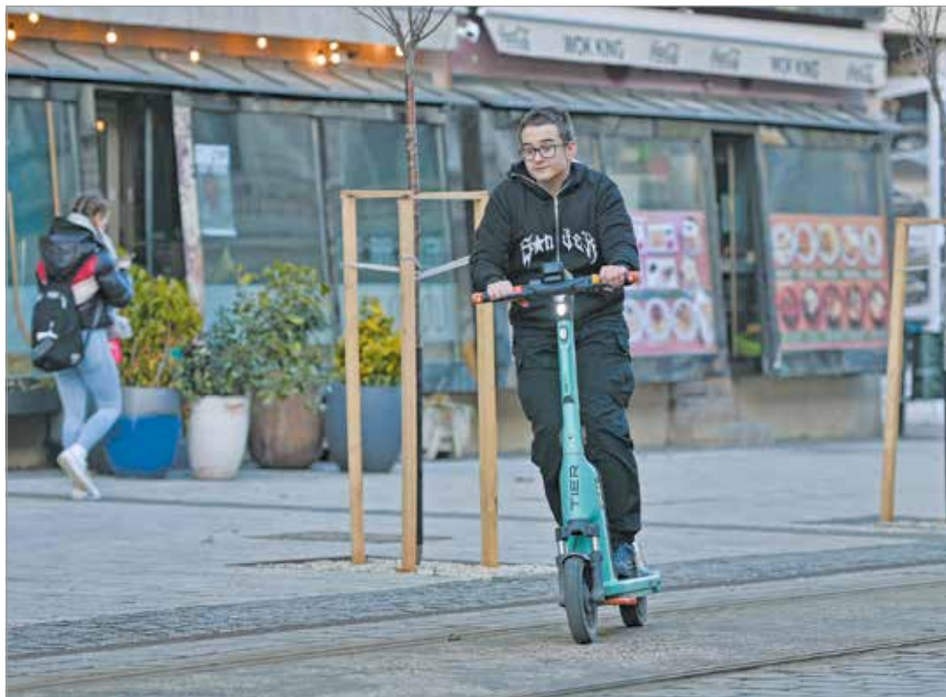
Miskolc az ötödik város volt, ahol megjelentek a Tier e-rollerai.

– A legfrekvenciáltabb helyek a Széchenyi utca környéke és az egyetem területe, de biztos vagyok benne, hogy a tavaszi és nyári időszakokban Miskolctapolca is fontos helyszín