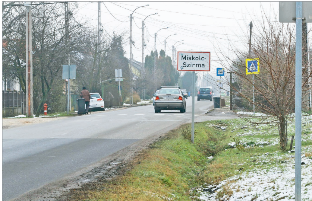
Miskolcnak sok kis városrésze van, melyeket nem célszerű választókerületi határokkal megbontani.

Névtelenül a jelenleg Nagy Ákos (Fidesz) által vezetett 11-es számú körzetet „számolják fel”, ami voltaképp annyit jelent, hogy a szomszédos kerületek között felosztják a többi közt a Vasgyár, a belváros és Miskolc-tapolca egyes szegleteit is magába foglaló, szociológiailag meg lehetőségek eklektikus zónát.