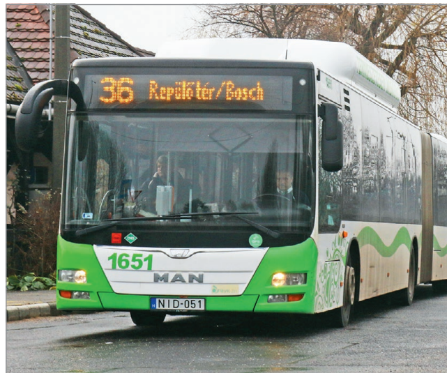
Ingyenes és zöld tömegközlekedést szeretnének.