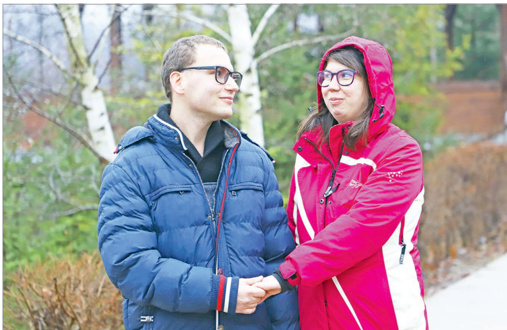
A fiatal pár már a közös jövőt tervezi.

– A legelső nap, amikor Szandi beköltözött a testvéreivel, hosszú ideig ki sem jött a szobájából. Aztán akkor, amikor kime-