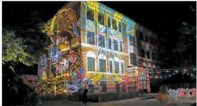
Gregovszki Gábor az egyedi grafikák mellett fényfestéssel és épületvitesséssel is foglalkozik.