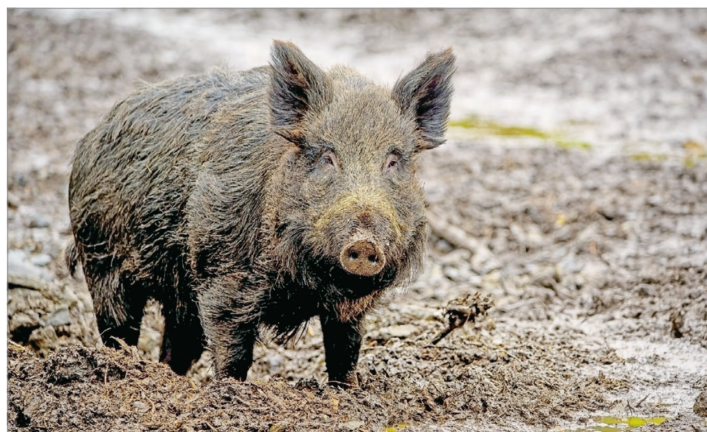
Az állami erdőgazdaságoknak joga van lezárni a vadászatok területét, de még ezeken túl is találkozhatunk a kihajtott vadakkal.