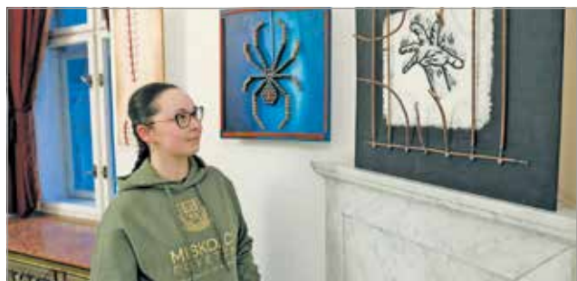
A tárlaton már nem használt hangszerekből készült művek tekinthetők meg.