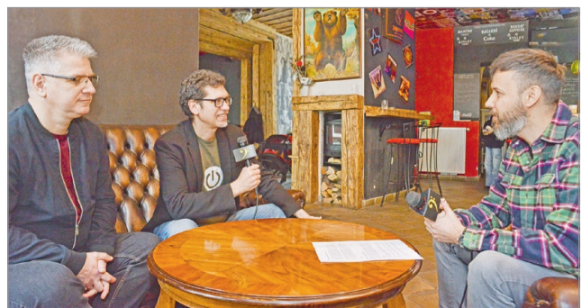
Ismét forog a kamera, fókuszban a miskolci zenei élet.

„Rezidenciánkon”, a pompás pubhangulatú Grizzlyben a HoldEső tagjaival beszélgetünk, akik egy frissen elkészült koncertklipet is hoztak magukkal. Végül a Kocsosnyafesztiválra gyúró Padgy and the Rats is beszél nekünk arról, hogyan állnak az új lemezzel. Tarstanak velünk, start hétfőn, a Híradó után, 18:25-től. K.I.