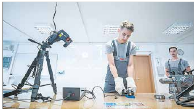
Nagy hangsúlyt fektetnek a gyakorlati képzésre.

A technikumok a középvizető-szintű technikusképzésen túl az egyetemek „előszobái” is lehetnek. A szakmai végzettségért járó plusz felvételi pontok mellett a következő tanévben öt miskolci technikum hirdeti olyan oklevelestechikus-képzést is, melyeknek szakmai – oktatási tartalmát egyeztetették az egyetemekkel, így azok kreditpontokat adnak egyes technikum tanulóknak. Ezzel rövidülhet a felsőoktatásban töltött képzési idő. B.I.