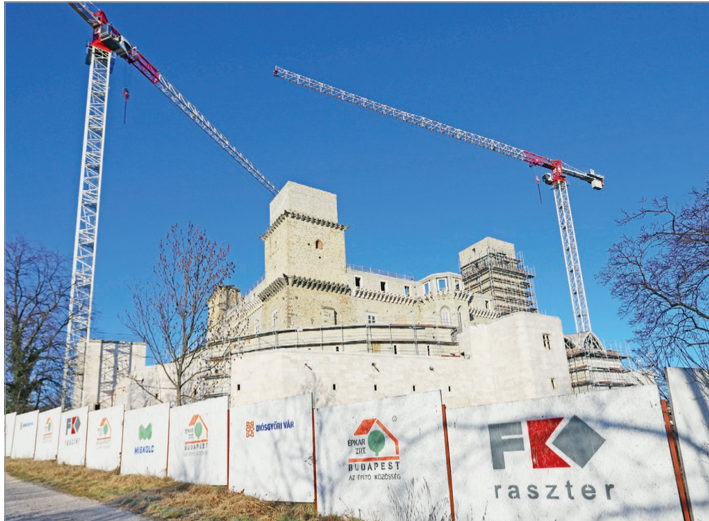
Hosszú szünet után folytatódik a Diósgyőri vár felújítása.

– Azt azonban látni kell, hogy üzemeltetői szempontból igen nehéz a kialakult hely-