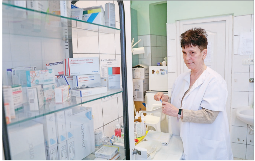
Miskolcon sincs elég utánpótlás fiatal háziorvosokból.

Ezt követően arra mutatott rá, hogy a háziorvosi pálya népszerűtlenségének okai különösen kistélepeken nem az orvosképzésben keresendők. Mivel a háziorvosi és házi gyermekorvosi praxisok magánvállalkozói kézbe kerültek, ez komoly anyagi terhet jelent. A betöltetlen praxisok esetében, ahol pedig az önkormányzatok veszik át az üzemeltetést, legtöbbször szűkös források és korlátozott eszközök állnak rendelkezésre.