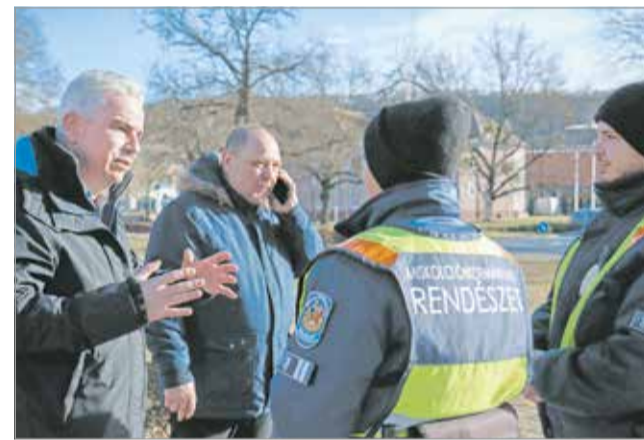
Figyeltek arra, hogy a járőrök folyamatosan elérhetőek legyenek.