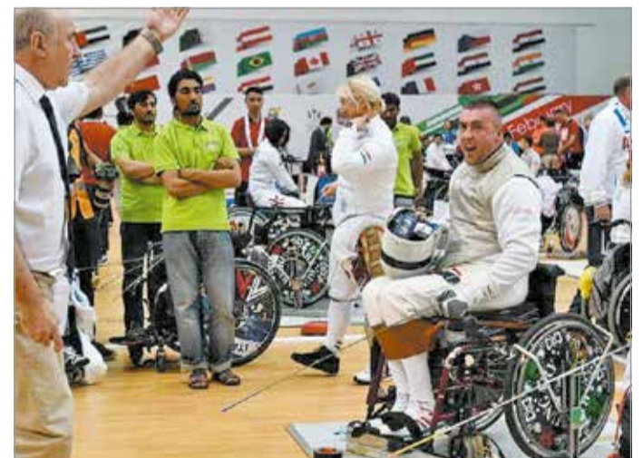
A diósgyőri sportoló szerint most ért be az eddig befektetett munka.

Párbajtőrben ellenben valamennyi csoportmeccsét meg-