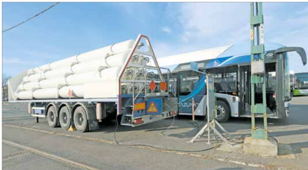
Nagy a verseny a gyártók között, februárban egy hidrogén-autóbust tesztel Miskolc.

– Minden megoldást tesztelnek, ott mindenre jut pénz. Ki fog derülni, melyik megoldás állja meg a helyét, és melyik nem. Nekik erre van lehetőségük, várjuk meg, hogy mire jutnak, és mi csak akkor vágjunk bele beruházásba, amikor már eldőlt, melyik