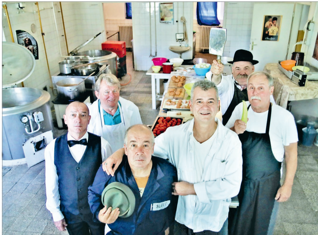
Az abszurd humorral fűszerezett, ugyanakkor érzelmekben gazdag történet a szocialista Petőfi Brigád mindennapjait eleveníti fel

– Nem kell azonban megijedni, ez a film nem történel-