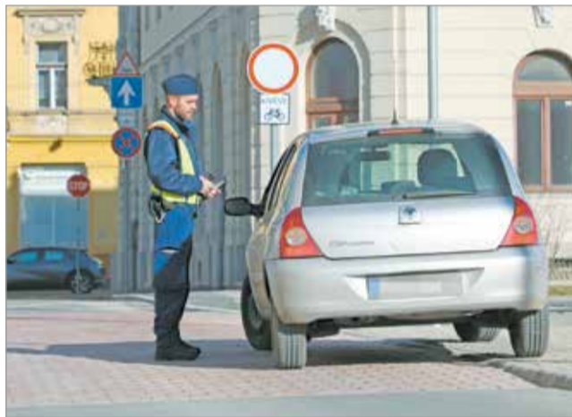
Felhívták a figyelmet a szabályokra.