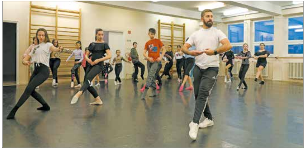
Egy mozgásművészeti terem és konferenciaterem is kialakítottak az intézményben.

Csóka Edit elmondása szerint új klubtermek jöttek létre az Ifiházban azzal is, hogy a Miskolci Kulturális Központ Nonprofit Kft. központi irányítása tavaly ősszel a Csen-