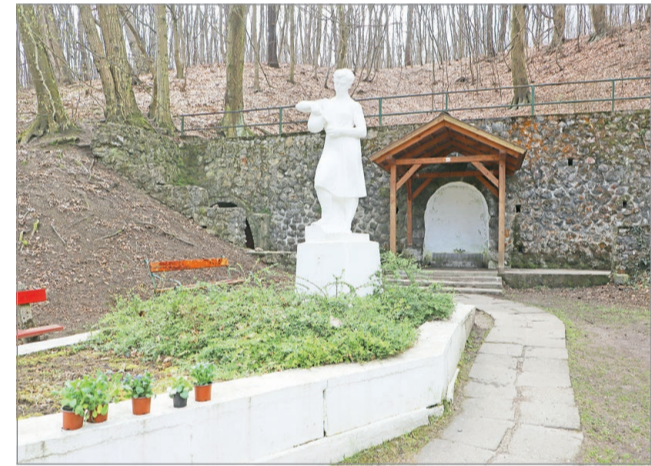
A Vilma-forrás mint védendő vízkincs a vármegyei értéktárba is bekerült.