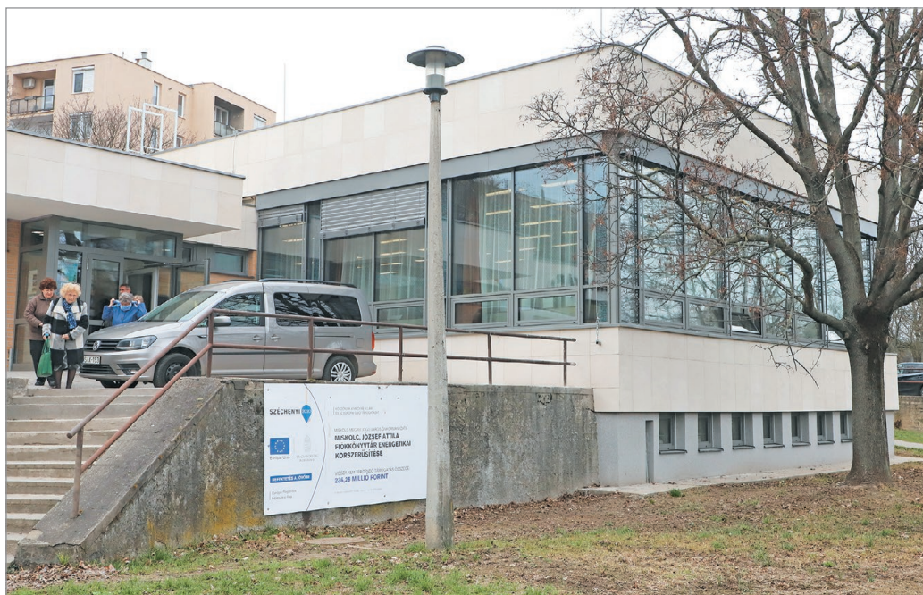
Szerda reggeltől ismét várja a látogatókat a megújult könyvtár.

– A könyvtárak olyan értékteret, amelyek az egyetemes emberi kultúrát őrzik az ott fellelhető nyomtatott irodalmi és tudományos munkákon keresztül. Így tehát minden ilyen intézmény lehetőséget biztosít azoknak, akik ide betérnek, hogy művelődjenek, új ismereteket sajátítsanak el, és egyben feltöltődjenek lelkileg. A könyv a