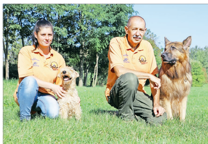
Saját logójára kért védjegyoltalmat a Spider.

– A Spider Mentőcsoporthoz, hosszabb nevében a Miskolci Speciális Felderítő- és Mentőcsoporthoz 1996 júliusában alapítottam meg, és én magam vezetem a mai napig. Sok helyen jártam külföldön, ahol nem volt praktikus a hosszú név, ezért egy idő után már csak a Spider Mentőcsoporthoz, illetve angolul a Spider Hungarian Rescue Team nevet használtuk. A mentőcsoporthoz logóját is én találtam ki, és rajzoltam meg saját kezűleg. Tehát az én szellemi termékem. Azóta a ruhákon ennek a magyar, illetve angol verziója található. Ez alapján azonosítanak bennünket Magyarországon és külföldön – hangsúlyozta, hozzátéve, hogy a Spider nevet anyakönyv-