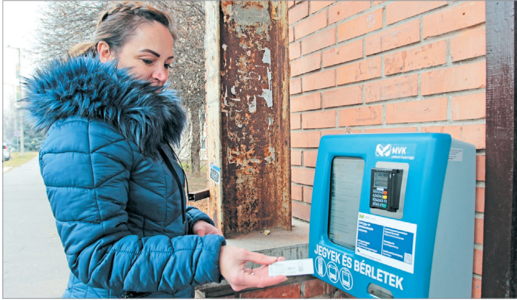
Több mint 330 ezer jegyet, illetve bérletet adtak el automatákon keresztül tavaly.

– A terveinket a valóság felülírta, az utasok szívesebben vásárolnak automatákból, mint telefonos applikációból, úgy tűnik, hogy a többség még mindig ragaszkodik ahhoz, hogy kézzel fogható legyen a jegye és a bérlete – kezdte.