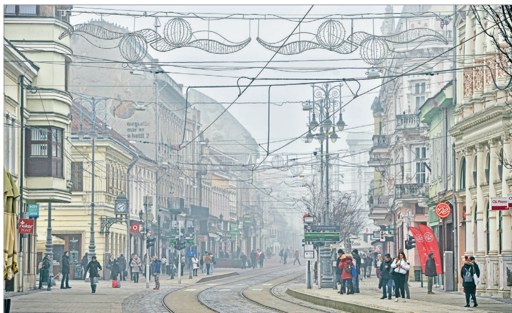
Az önkormányzat partnernek tekinti a belvárosi üzletek tulajdonosait, a szolgáltatókat.

Kifejtette, a rendészeti statisztikák alapján 1400 beavatozás történt a sétálóutcán. – A közrenddel foglalkozni kell. Az éves támogatáson felül havi 3,2 millió forint pluszforrást szánunk arra, hogy több járőr páros figyeljen a belváros rendjére – mondta, hangsúlyozva: az önkormányzat nem „fejőstehennek” tekinti a belvárosi üzleteket, szolgáltatókat,