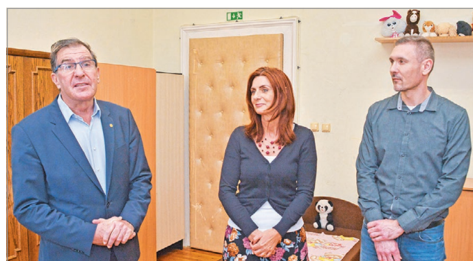
Közel egymillió forintot utaltak át az otthonnak.