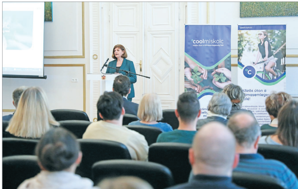
Varga Andrea alpolgármester közös cselekvésre buzdít a klímavédelem terén.

Ebben az együttműködésben egy fontos lépés az, hogy civilekkel, vállalatokkal, kis- és közép vállalkozásokkal, kamarával dolgoznak együtt, akik és amelyek pontosan látják és értik, hogy egyénileg is felelősek vagyunk azért, hogy milyen változtatásokat tudunk tenni, tette hozzá. A magánszemélyek szerepe is hangsúlyos, hiszen csak velük együtt lehet eredményes az összefogás. Mindenki a saját területén, lehetőségeihez mér-