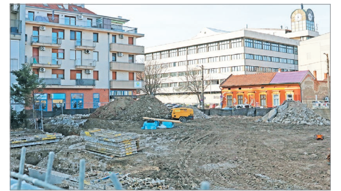
Már az alapozásnál tartanak.