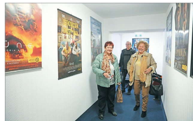
Népszerűek a Salkaházi programjai.