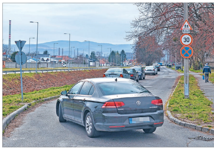
Innen, az Aldi felől lehet egyirányú az utca.