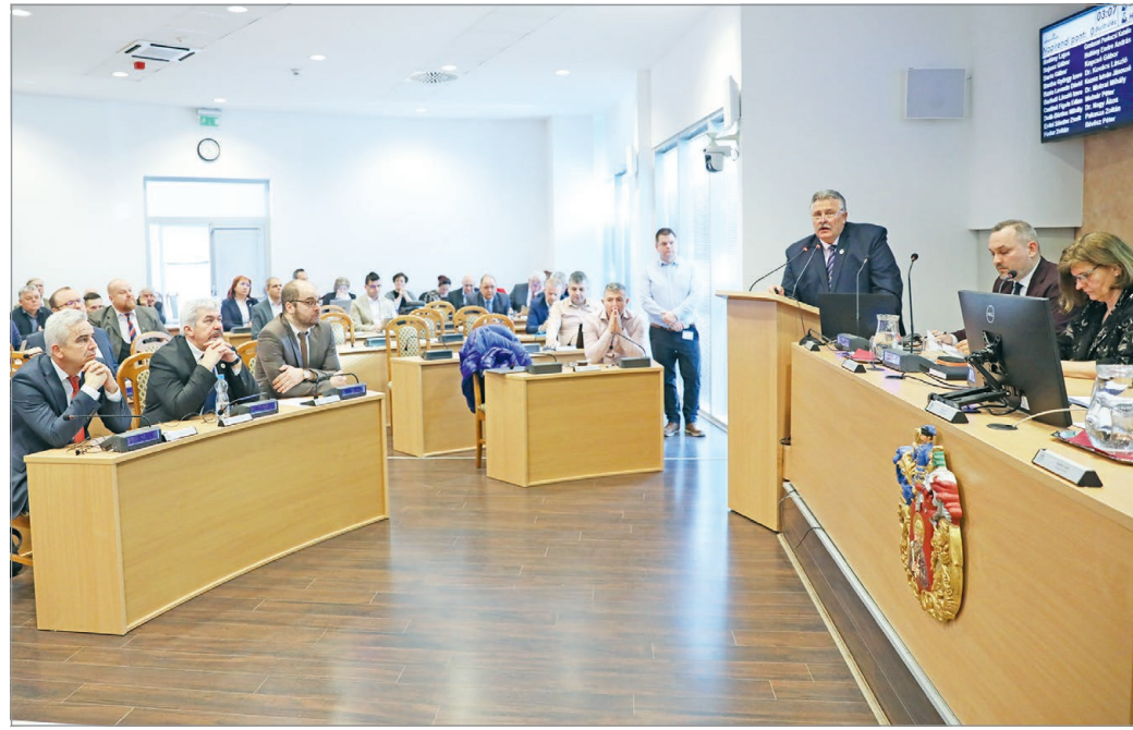
Idei első ülését tartotta a közgyűlés, fontos előterjesztések kerültek a grémium elé.