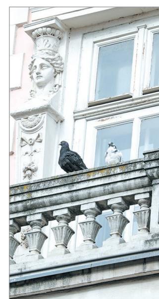
Kiválóan akklimatizálódtak.

A városi galamboknak – a feldühített városlakóktól eltekintve – nincs természetes ellensége, így emberi beavatkozás szükséges a populáció visszaszorításához. A fentiekben túl fény- és hangriasztás-