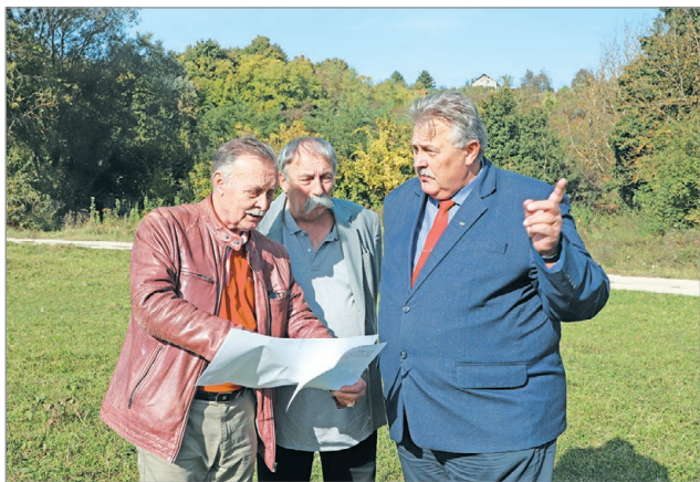
Helyszíni bejáráson a Bedegvölgyben.