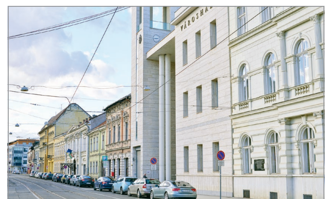
Az ellenzéki önkormányzatok elvonásokkal szembesültek.

Egy másik ábrát is készített a blog, amin az látszik, hogy a politikai favoritizmus első sorban a 3 ezer főnél nagyobb településeknél és a kormány saját hatáskörében hozott támogatási döntéseinek figyelhető meg. MN