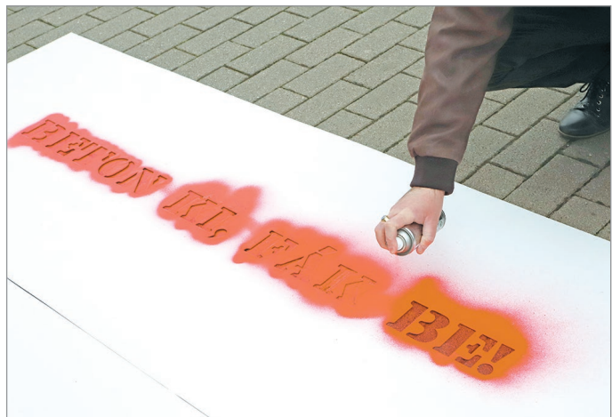
„Beton ki, fák be!” – akció a Vörösmartyt.