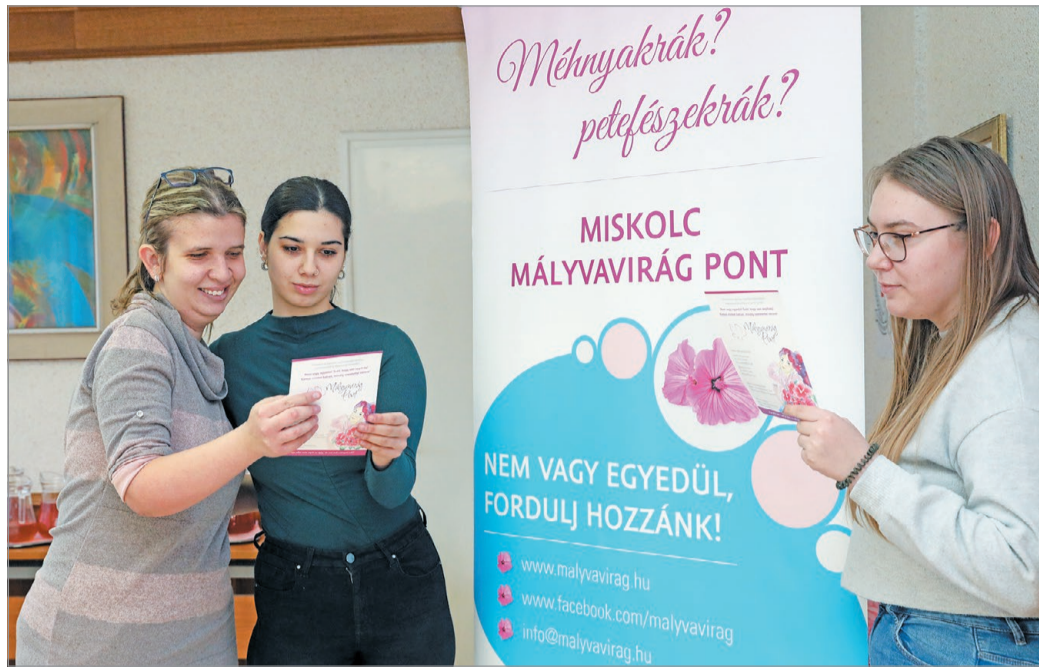
A Málvavirág Alapítvány felvilágosító kampánya Miskolcon, február végén.

– A humán papillomavírusnak több mint száznegyven fajtáját ismerjük, ebből megközelítőleg negyven az, ami a genitális traktusra hatással van, ott fertőz. Ezek között vannak rákkeltők és kevésbé azok. A HPV 16-os és 18-as törzse fe-