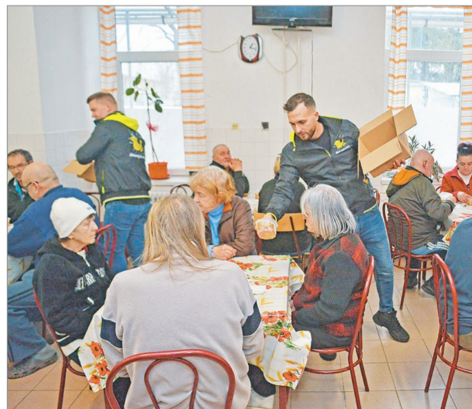
A hajléktalanszálló lakói hálásak voltak a fesztivál szervezőinek kedvességéért.