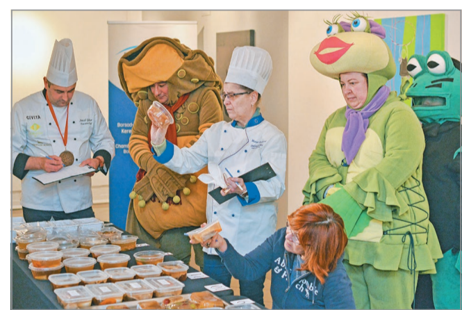
A zsűrinek azt kellett eldönteni, hogy a sok jó kocsonya közül melyek a legjobbak.

Az izkocsonyaversenyre tizenegyes hagyományos és hat különleges/kreatív kocsonya érkezett. A tisztaság, íz, állag,