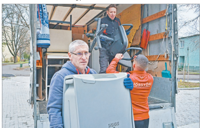
A garanciális hibajavítások után végre birtokba vehetik az új épületet az orvosok és a betegek is.

– Csak amikor átvettük a város irányítását, akkor sikerült megoldást találni például a parkolási helyzetre. Korábban ilyen nem volt, de a helyek szavazhattak is az ügyben.