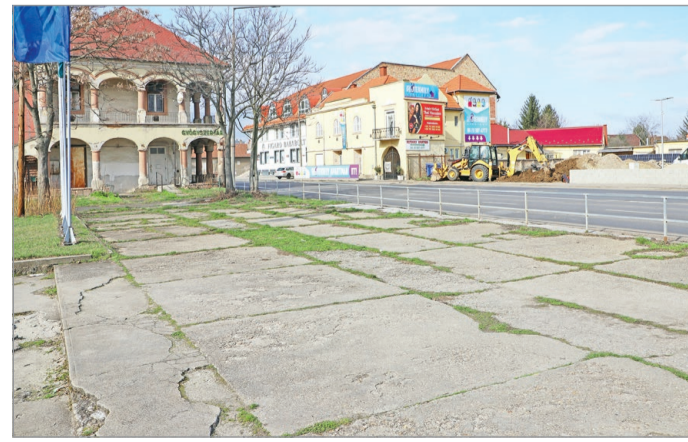
A városvezetés abban bíz, hogy a közterület fejlesztése megmozgassa a volt patika tulajdonosának fantáziáját is.

A fejlesztés TOP Plusz európai uniós forrásból valósulhat meg az önkormányzat városr-