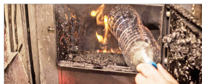
Sok egyéb mellett a PET-palack sem alkalmas fűtésre.

A válaszáért nem kell a szomszédba menni. A hulladék ége-