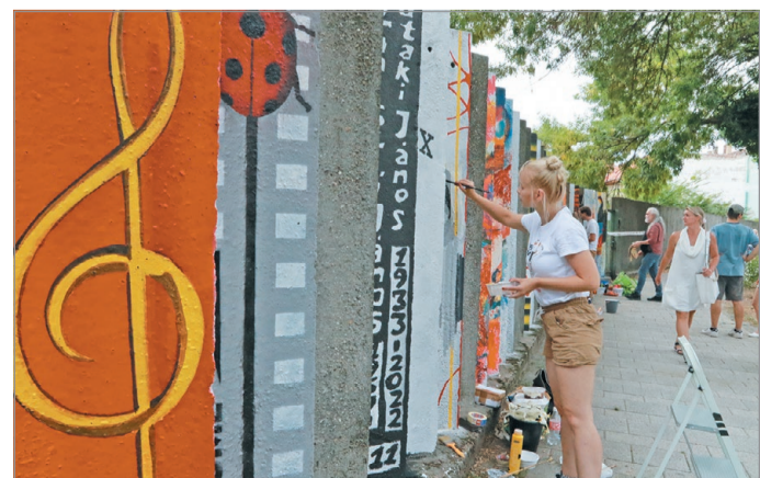
A Csengey kert kerítését még 2022-ben, az első Hangszínhely fesztivál idején kezdték el festeni.