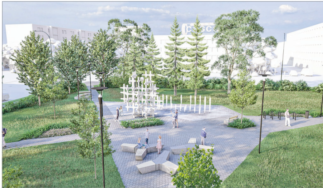
A különleges térképen a folyamatban lévő, a lezárult, a tervezés, illetve kivitelezés alatt álló fejlesztések is megjelennek.

Az említett hatótáv bővíthető, akár több kilométerre is. A közösségi médiából ismert „beszívással” számunkra fontos, de más városrészen megvalósuló beruházásokat is követhetünk (mi például a Diósgyőri vár kapcsán éltünk ezzel az opcióval – a szerző). Így aztán bármi változás történik az adott projekt-