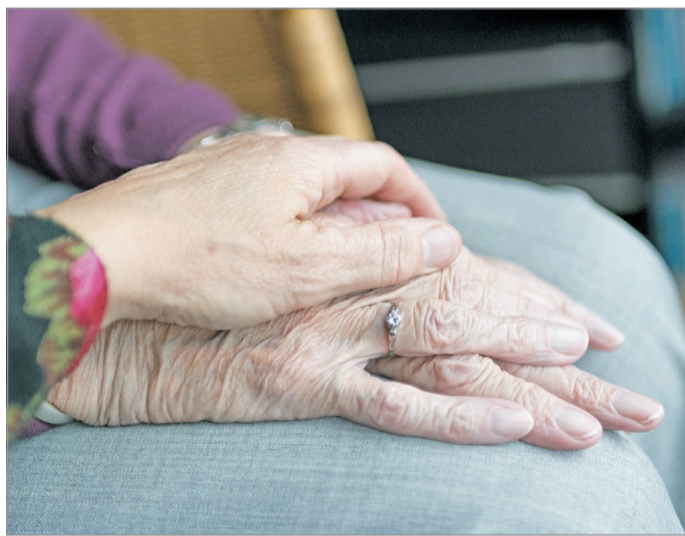
Fontos odafigyelni a tünetekre.