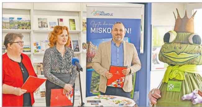
Az idén jubiláló városnéző séták mindig nagy népszerűségnek örvendenek.

A sajtótájékoztatón jelen volt Szopkó Tibor alpolgármester, aki hangsúlyozta, amikor közgyűlés elé kerül a cég önkormányzati finanszírozása, kollégáival mindig