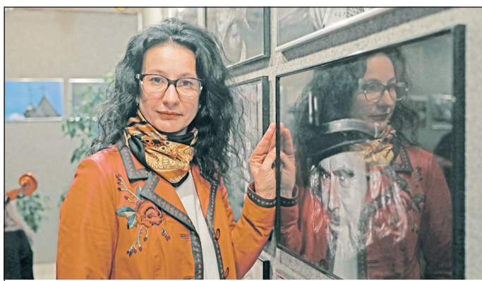
Dániel Mária Magdolna a múltat próbálja megragadni a jelenben a képein.