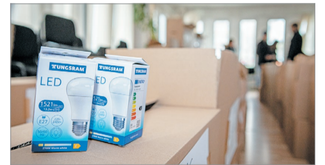
Több körben lehetett pályázni Miskolcon izzócsomagra.