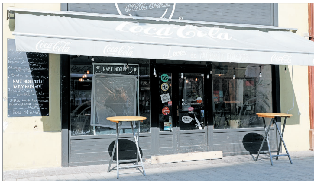
Több belvárosi üzlet kirakatát is betörték a vandál fiatalok.