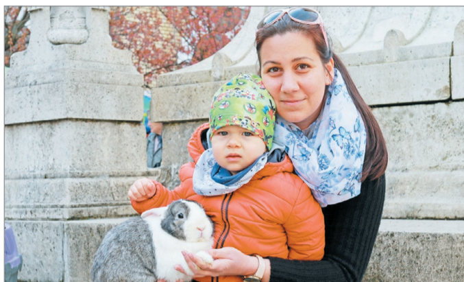
A húsvét jegyében telik a márciusi termelői nap.

Készülünk együtt a húsvétra! – felkiáltással kézműves-foglalkozással (is) vár minden érdeklődőt a Miskolci Termelői Nap az Erzsébet téren március 17-én, vasárnap reggel 9 és délután 1 óra között. Itt mindenki beszerezheti kedvenc kézműves portékáit és a minőségi bioélelmiszereket. De ez a nap nem csak a bevásárlásról kell hogy szol-