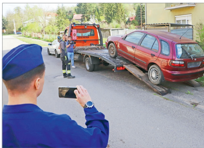
A MIÖR az elmúlt években fokozottan odafigyelt az elhagyott járművekre.

Két üzemképtelen járművel kevesebb Miskolc utcáin. A MIÖR munkatársai csütörtök reggel csaptak le a roncsokra.