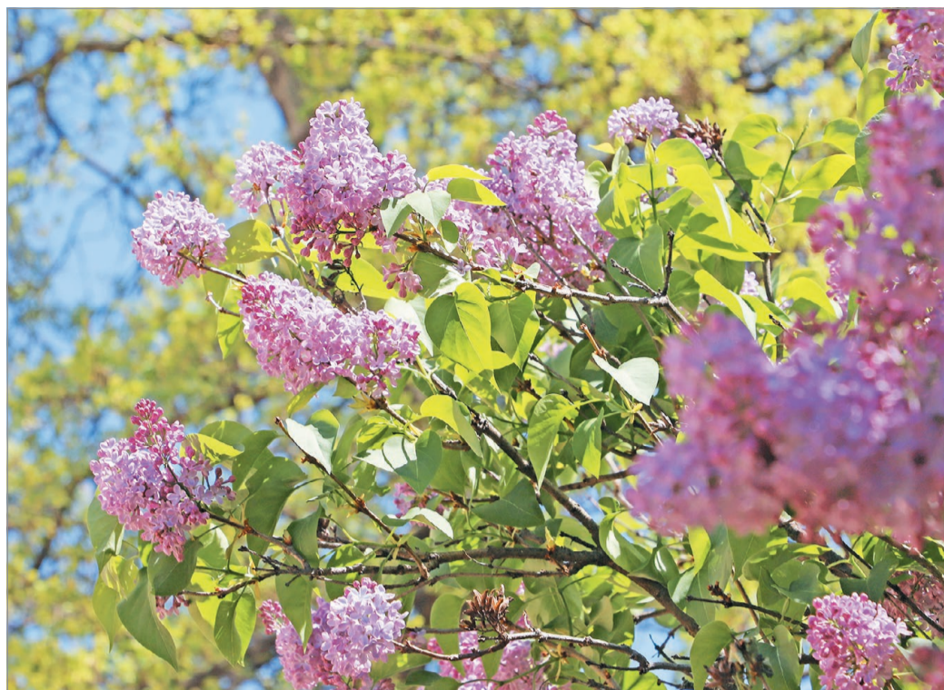
Sok növény, így többek között az orgona is korábban virágzik a megszokottnál.

Láthatjuk tehát, hogy a nagy mennyiségű sivatagi por megjelenése Európában nem általános jelenség, de a nagymértékű hőmérséklet-ingadozásról ugyanez nem