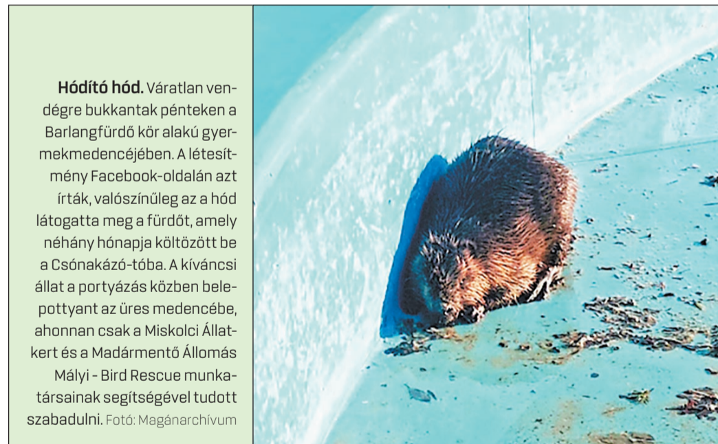
Hódító hód. Váratlan vendégre bukkantak pénteken a Barlangfürdő kör alakú gyermekmedencéjében. A létesítmény Facebook-oldalán azt írták, valószínűleg az a hód látogatta meg a fürdőt, amely néhány hónapja költözött be a Csónakázó-tóba. A kíváncsi állat a portyázás közben belepottyan az üres medencébe, ahonnan csak a Miskolci Állatkert és a Madármentő Állomás Mályi - Bird Rescue munkatársainak segítségével tudott szabadulni.