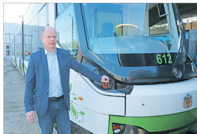
A 612-es számú villamosba tavaly áprilisban egy rendőrautó rohant bele.