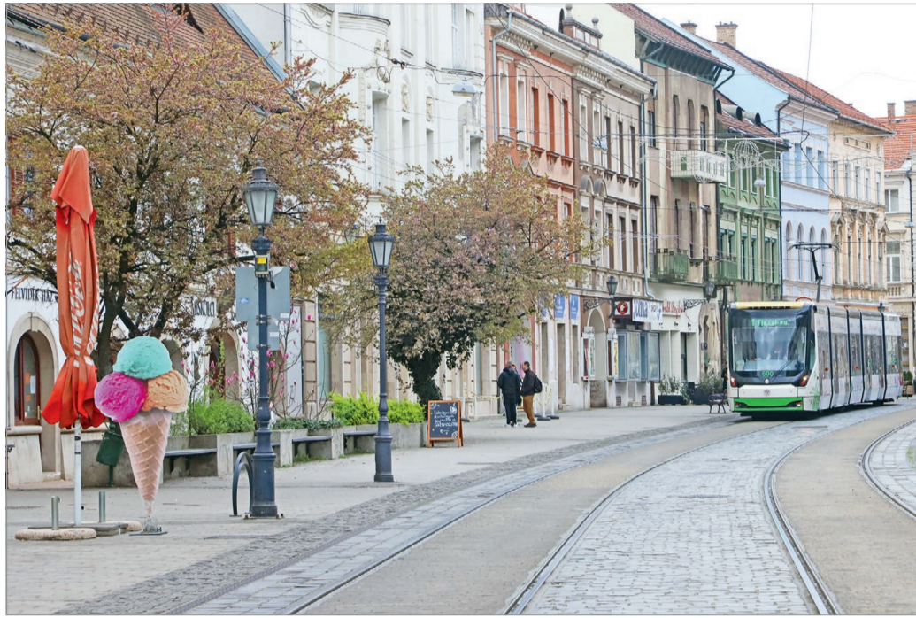
Az alpolgármester fejlődési lehetőséget a szolgáltatászektorban lát még.

– Ezt a feladatot a Miskolc Holding Zrt. Gazdaságfejlesztési Igazgatósága látja el, ahol nagyon jó szakembereink vannak. A befektetők számára rendkívül fontos az egyablakos ügyintézés is, ezt szintén tudjuk biztosítani a számukra. Sokszor segítünk például infrastruktúra-fejlesztési kérdésekben, a helyi építési szabályzat vonatkozásában is egyablakon keresztül tudjuk őket támogatni a folyamatban. Segítjük továbbá az egyetemmel, a szakképzési centrummal, a munkaerőkölcsönzési cégekkel való össze-