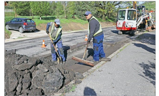
Pénteken egyebek mellett Percesen is javították az úthibákat.