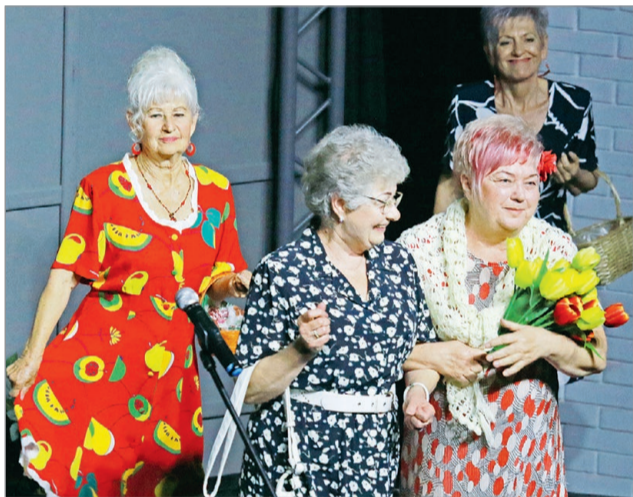
A programot először tavaly szervezték meg.