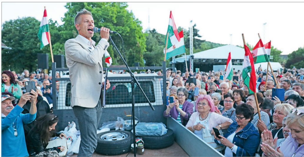
A TISZA Párt alelnöke a legtöbb nagyobb borsodi várost felkereste a héten.

Elmondása szerint az ország bármely pontján is jár, mindenütt ugyanazzal kell szembeülnie: „nagyurak és alispánok” uralják a vidéket. Úgy véli, habár „a rogáni propagan-