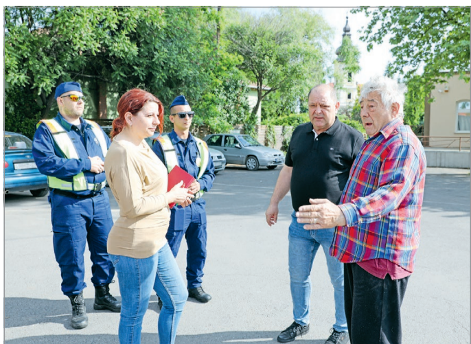
Mindkét településrészen rendszeresen járőröznek a rendészek.

Ingyenesen hívható zöldszám (0–24-óraig): 06-80-46-00-46