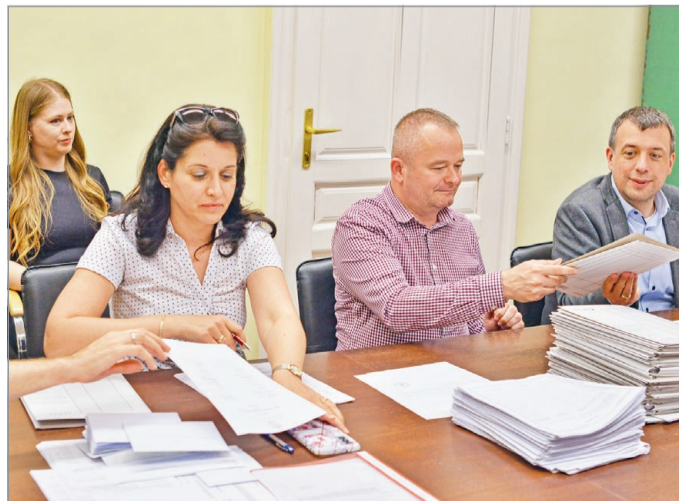
Sűrű napjai voltak a HVB tagjainak: hétfőn és kedden is üléseztek.

idő előtt adták le ajánlásaikat, a választási bizottság kedden vette nyilvántartásba. A HVB végül hét polgármesterjelöltet tudott a megfelelő számú és érvényes ajánlások tükrében nyilvántartásba venni. Az egyéni körzetekben eszerint négy és nyolc közötti számban indulnak majd jelöltek. A jóformán véglegesnek tekinthető lista birtokában a bizottság hétfőn és kedden is sorolt: a szavazólapokon feltüntetett jelölti listák mindezzel meg is születtek.