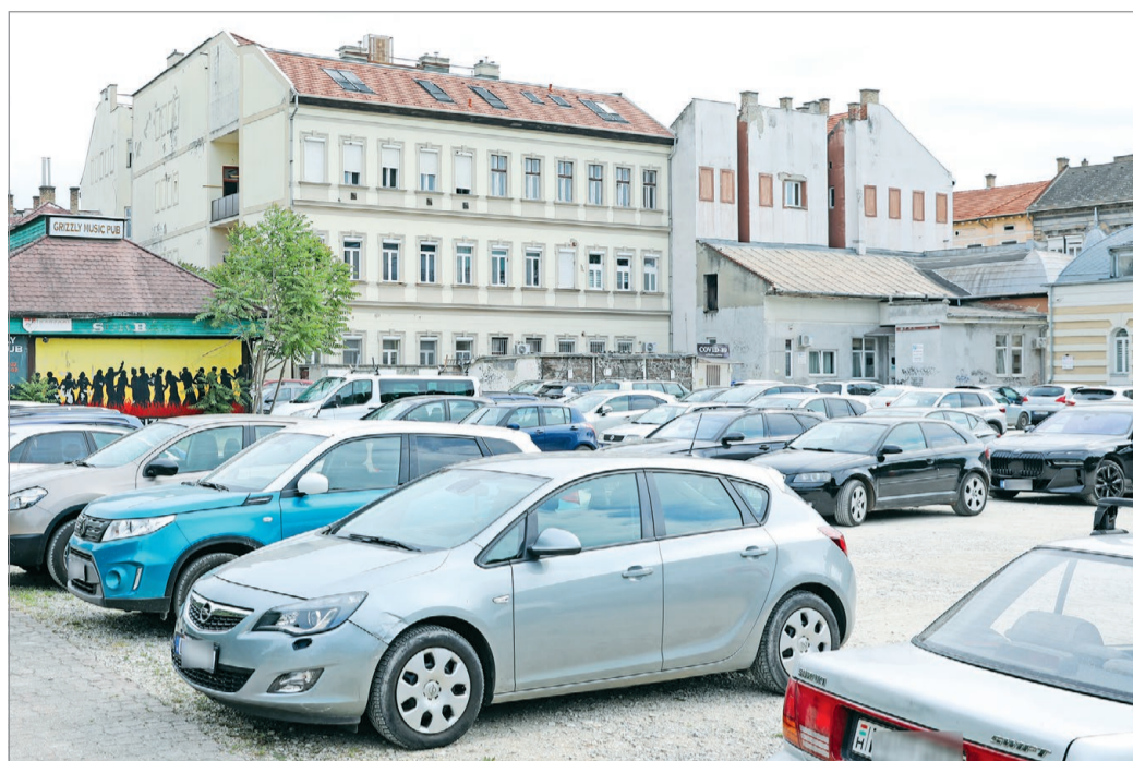
Impozáns társasház épül rövidesen a murvás parkoló helyén.

Ahogy arról többször írtunk, a telket még hosszú évekkel ezelőtt vásárolta meg az Avalon, és először egy irodaházat terveztek ide. Ennek megvalósításától – a városvezetéssel és a helyi lakosokkal történt hosszas egyeztetés után – elálltak (irodaházat végül a Zsigmond utcán, a régi Északtervezési helyén létesítettek). Ezt követően a város-