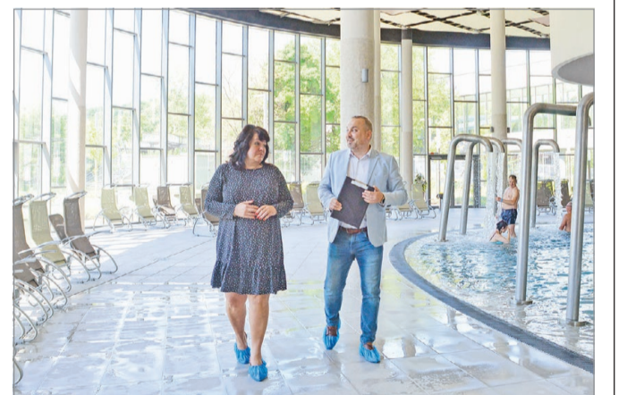
A bejárást célja az volt, hogy ráirányítsák a figyelmet az Ellipsumra.

A Barlangfürdőben már a megtelt táblát is nem egyszer kellett tenni. Az Ellipsumnak ugyan még nincsen olyan ismertsége, mint a Barlangfürdőnek, meglehetősen hányatott sorsa volt korábban a műszaki problémák, garanciális javítások, aztán a covid-járvány, majd az energiaválság miatt, de jó esélye van a jövőben a felzárkózásra, hiszen a fürdőkomplexum mindent szolgáltatást nyújtani tud, ami ma egy korszerű fürdőtől elvárható.