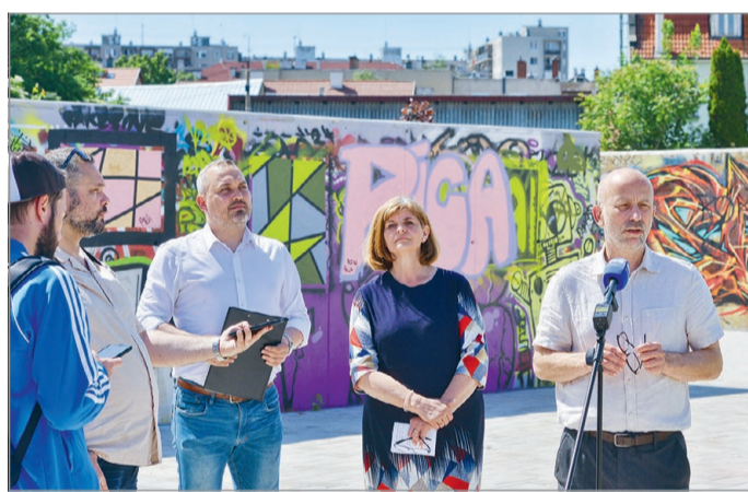
Értékelték az alkotópark első évét.

lósult alkotóparknál nagy szabadságot kapnak a különböző naiv, alternatív vagy profi alkotók, ugyanakkor a téren is jól látható helyen kitáblázott szabályokat mindenkinek be kell tartania.