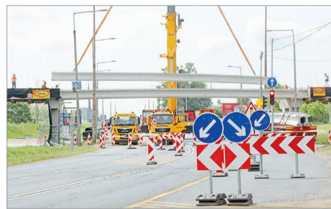
Ütemterv szerint halad a harsányi felüljáró újjáépítése.

Polgár Tamás kiemelte, a gerendák beemelése után rövidesen megkezdődik az útpálya építése. „Először az egyútdolgozó vasbeton monolit pálya-