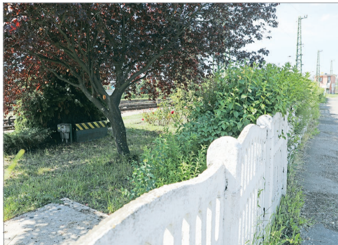
A holttestet a pályaudvar épülete melletti bokros területen találták meg.