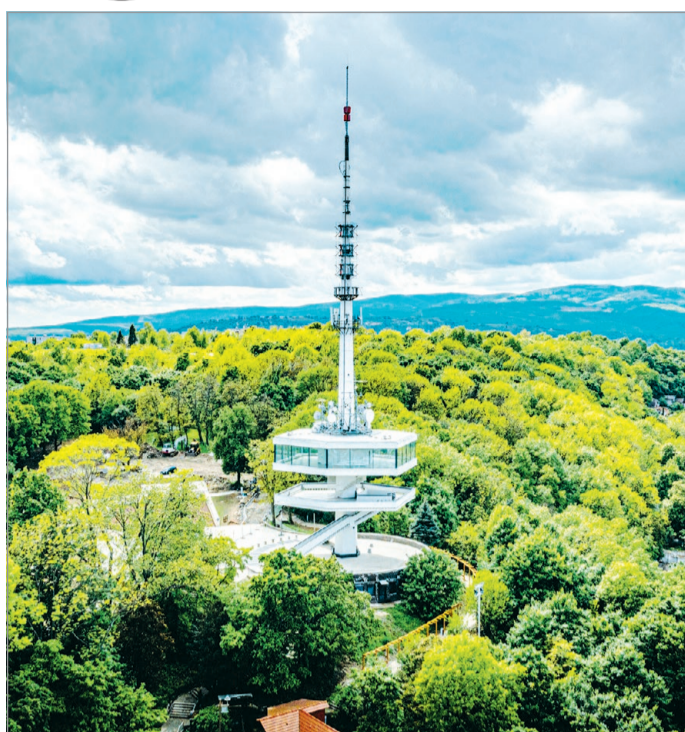
A főépítész szavazásán jelenleg az Avasi kilátó vezet.

Elmondta, hogy a problémákat ő is látja, de ugyanakkor azt is, hogy Miskolc máig egy nagyszerű város, rendkívül jó