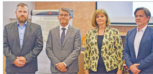
Egyetértettek a kódex elveivel.