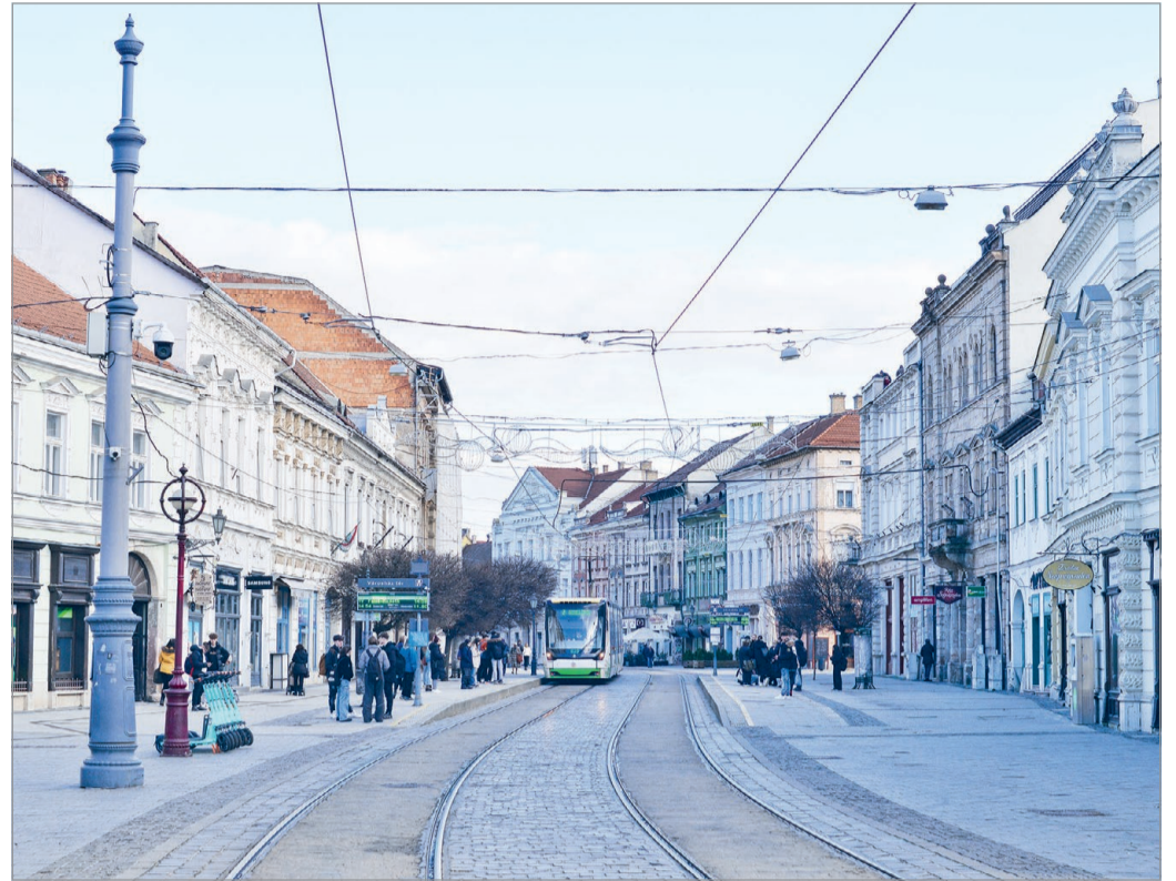
Komplex terve van a városnak a sétálóutca és környezetének megszépítésére.

A legutóbbi közgyűlés elfogadta, hogy a kihelyezett zöldnövényzet után ne kelljen terü-