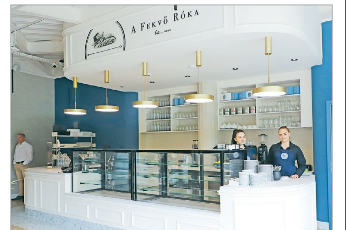
Megkoronáznák a tapolcai kikapcsolódást.