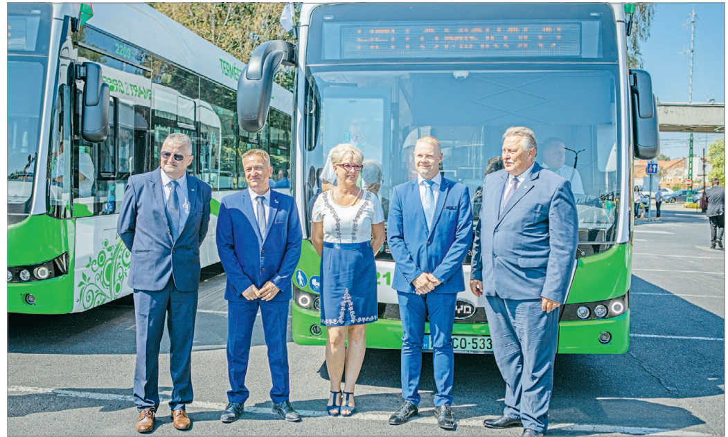
A BYD elektromos buszait 2022-ben adták át Miskolcon.