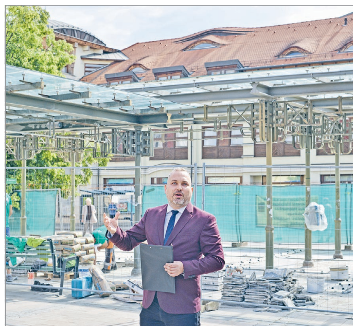
Biztonságosabbá válik a buszmegálló.

A két esztendeje bevetett új technológia olyannyira bevált, hogy megszületett a döntés: idén a várakozó terület fennmaradó részét is azzal építik át. Ezzel pedig nem pusztán a szűk értelemben vett buszmegálló, de annak tágabb környezete is esztétikus megjele-