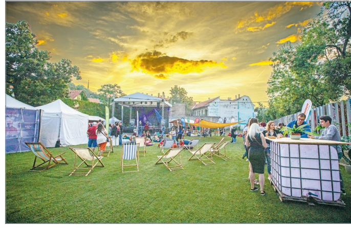
A GasztoPlacc fő tematikája a bor és jazz.

Évek óta nagy sikerrel fut a kulináris élvezetek és a zene fúziójából született GasztoPlacc, idén nyáron a Csegey-kert és a Lovagi tornák tere ad majd otthont a rendezvényeknek. A rendszeres látogatóknak nem újdonság, hogy különféle tematikával kurokollnak elő a Miskolci Kulturális Központ rendezvényszervezői, hogy évről évre színvonalasabb programokat kínáljanak. Nem lesz ez másképp május 31-én, pénteken sem, amikor