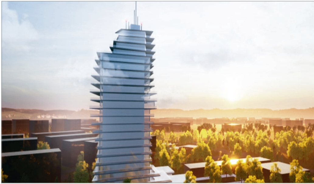
Akár ilyen is lehetne a Szentpéteri kapuban található húszemeletes épület a felújítás után

A szakember úgy véli, habár Miskolc nemzetközi viszonylatban nem számít igazán nagyvárosnak, egy manhattani vagy sanghaji miliót nyomokban megidéz, közép-európai felhőkarcoló nem pusztán a városrészt, de a város egészének látképehez és presztízséhez is hozzátenne. Állítja mindezt úgy, hogy ő is belátja: az „A-kategóriás” irodaházak iránti kereslet a világszerte