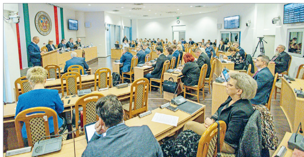
Novemberi rendes ülését tartotta a képviselő-testület.